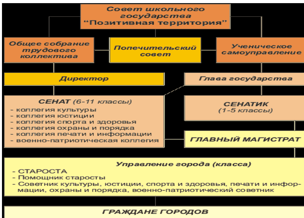
Схема школьного государства «Позитивная территория» выглядит следующим образом:

Развитие ученического самоуправления в школе